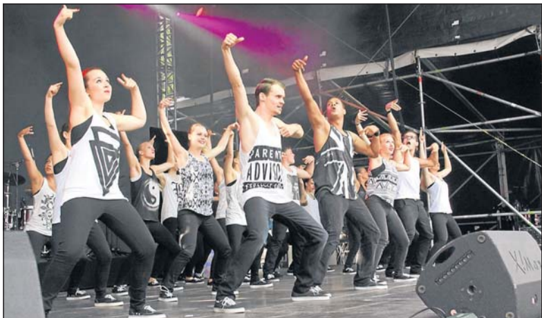
Die V 2-Hip-Hop-Crew hat die Sympathien der Zuschauer von Beginn an auf ihrer Seite. Die rasante Tanzshow zündet beim Publikum.