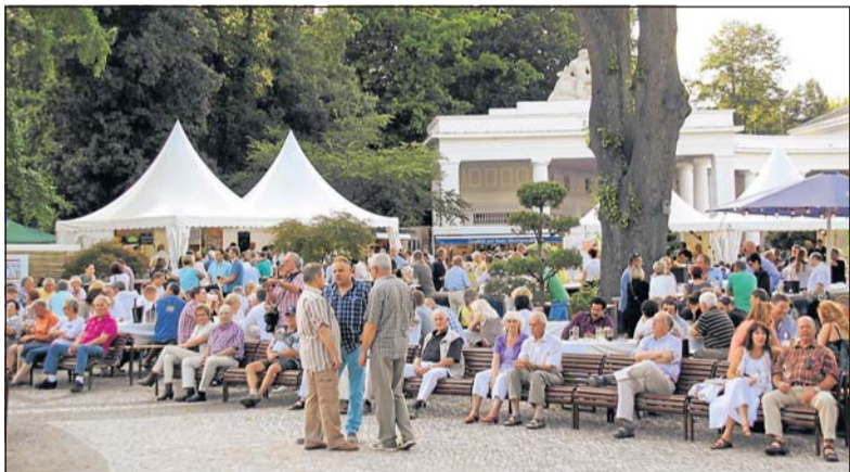
Je später es am Parklichter-Samstag wird, desto schwieriger ist es, im Gastro-Dorf vor der Wandelhalle einen freien Sitzplatz zu ergattern.