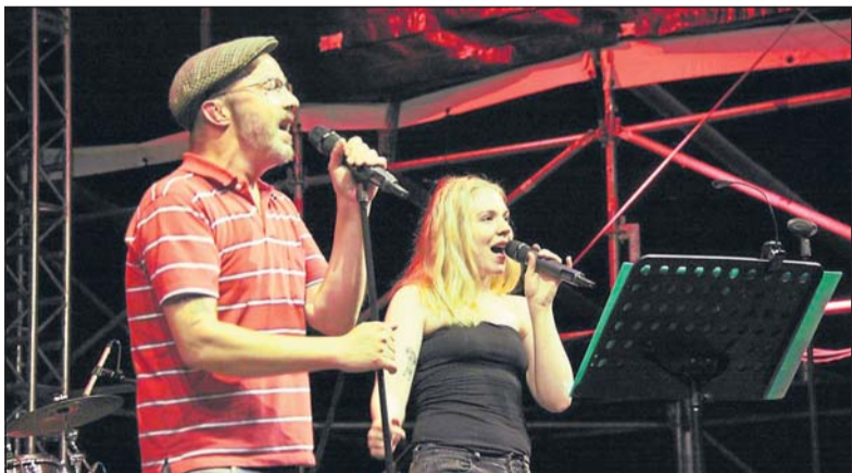
Nach dem Feuerwerk geht die Party auf und vor der Hauptbühne erst richtig los. Die Band Soulkiss aus Bielefeld sorgt für die passende Musik.