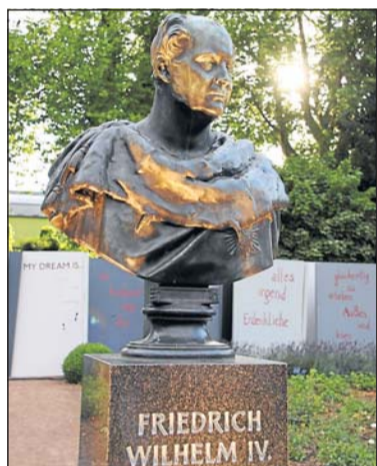
Eine Büste von Kaiser Friedrich Wilhelm IV. ist einmalig inszeniert.