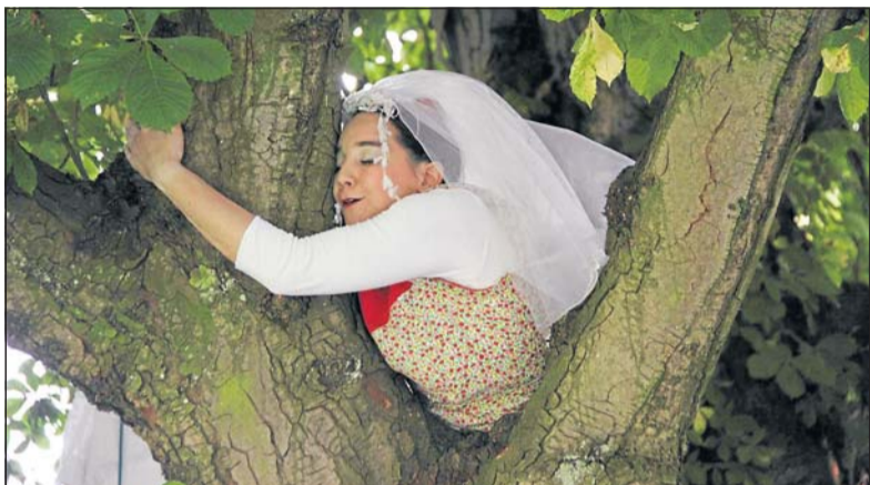
Zeitgenössisches Theater an ungewöhnlichen Orten: Der Schauplatz dieser Spielszene ist die Krone eines urwüchsigen alten Baumes.