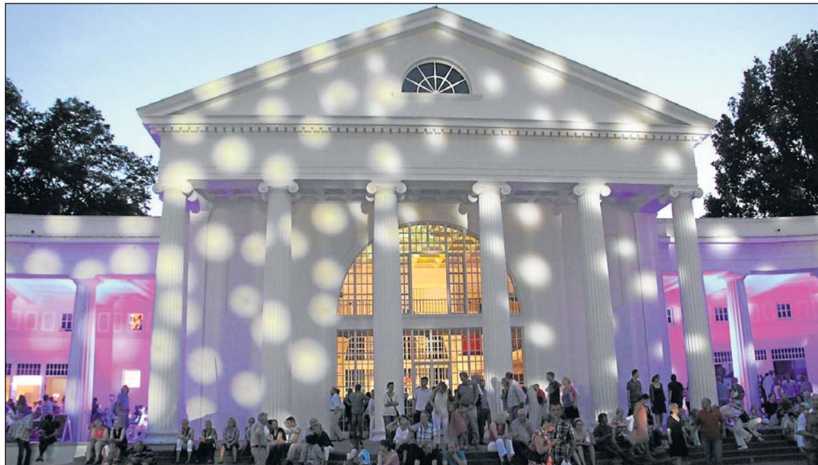
Fantasievolle Lichtprojektionen verwandeln die Wandelhalle im Kurpark mit Beginn der Dämmerung in einen geradezu mystischen Ort. Zahlreiche weiße Lichtpunkte sollen den Sternenhimmel symbolisieren.