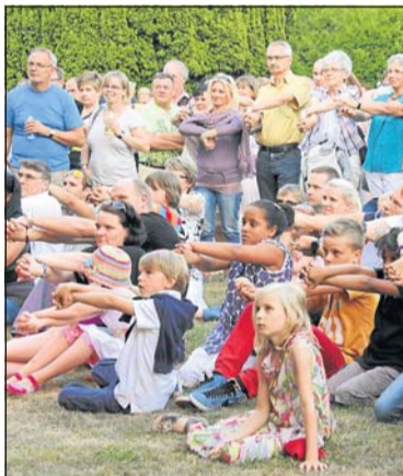
Wenn die Zuschauer aufgefordert werden, machen sie eifrig mit.