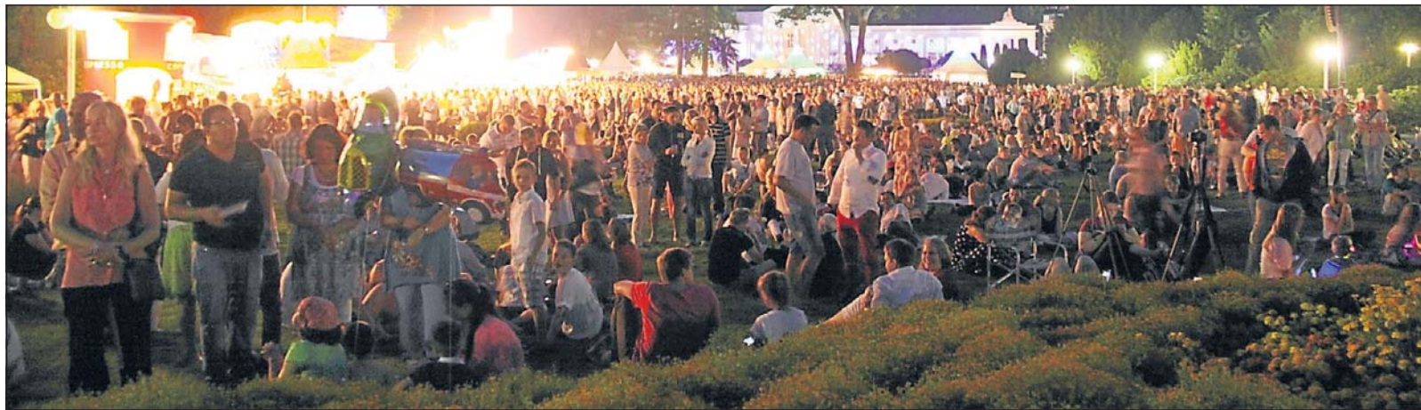
Am späten Samstagabend, kurz vor Beginn des 18-minütigen Feuerwerks von Flash Art, ist es im Kurpark von Bad Oeynhausen rappelvoll. Nicht nur auf den Wegen drängen sich unzählige Besucher. Auch die Grünflächen dazwischen sind mit Menschen übersät.