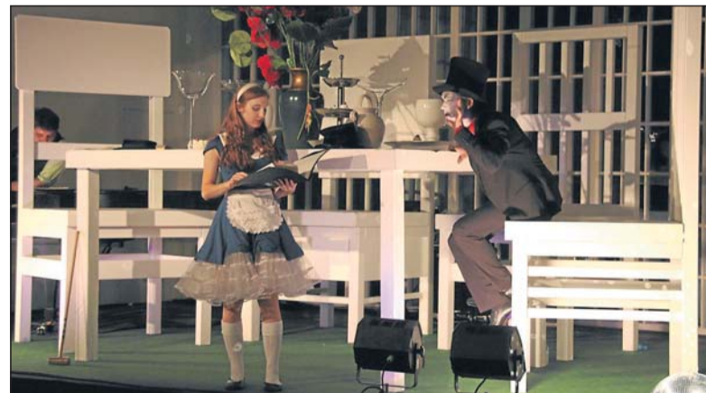
Eine szenische Lesung mit Auszügen aus dem Märchen »Alice im Wunderland« können die Zuschauer in der Wandelhalle mitverfolgen.