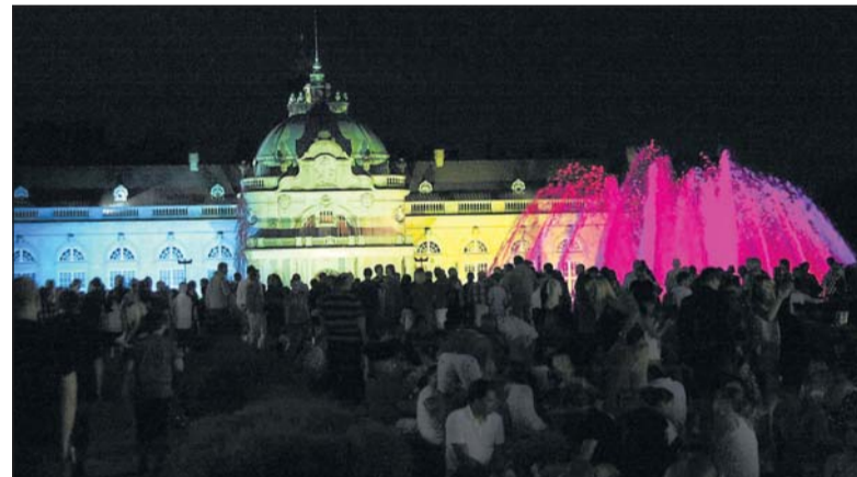
Kurz vor Beginn des Feuerwerks ist der Platz rund um die Fontäne gut gefüllt. Die bunten Farbenspiele ziehen die Besucher magisch an.